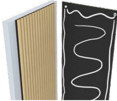
Liimalla asennettaessa liimaa levitetään kauttaaltaan levyn taakse.